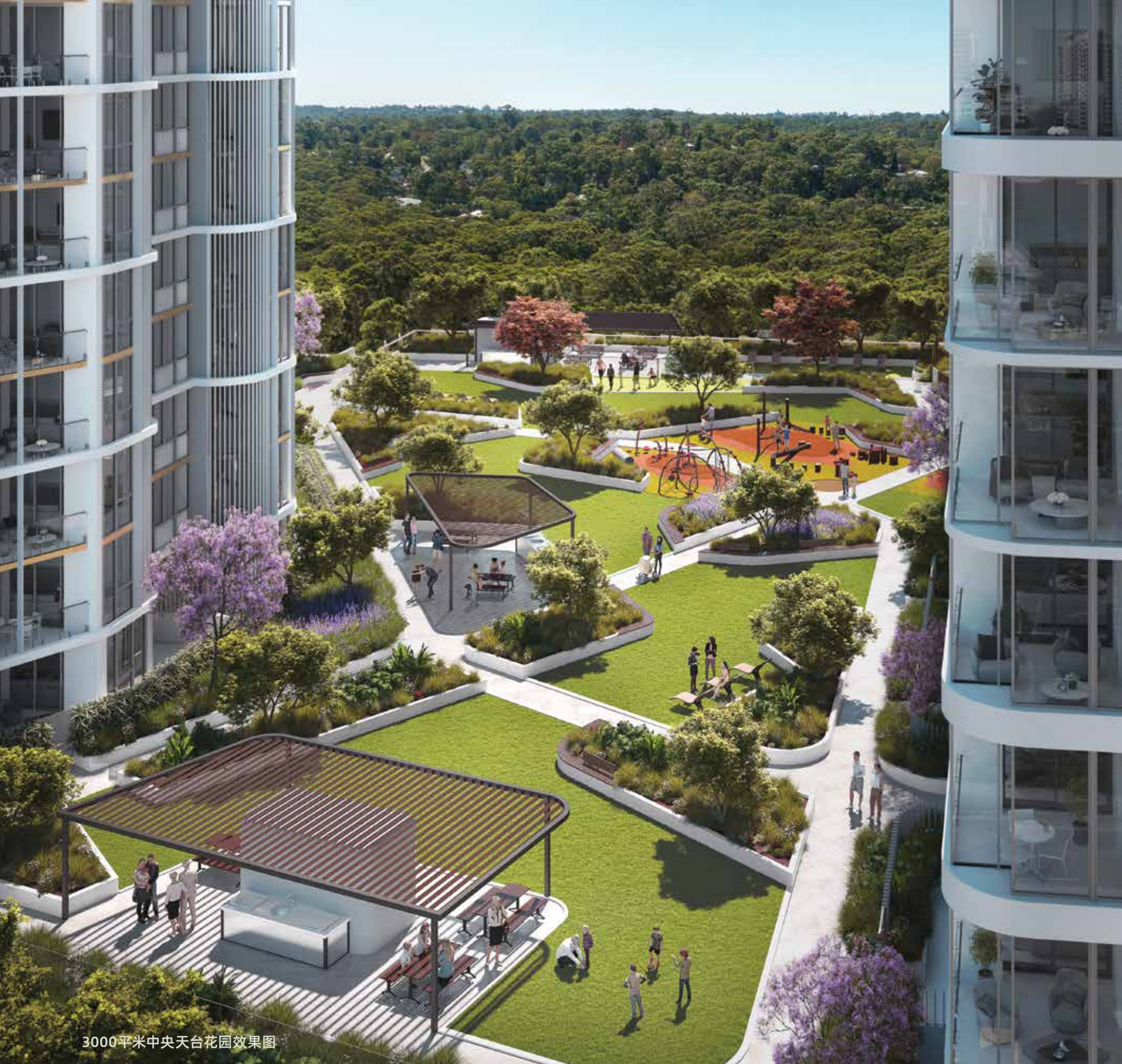
3000平米中央天台花园效果图