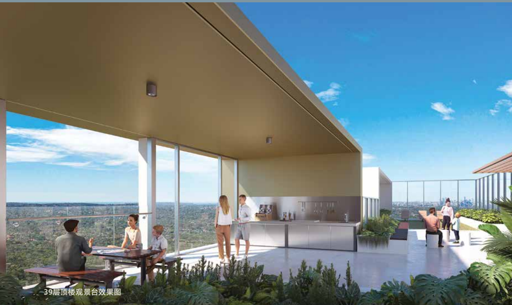
39层顶楼观景台效果图

Trilogy从高级的五星级配套设施到儿童日托中心的每一个细节都经过细致考量, 达到让生活更愉悦、便捷且人性的目的。