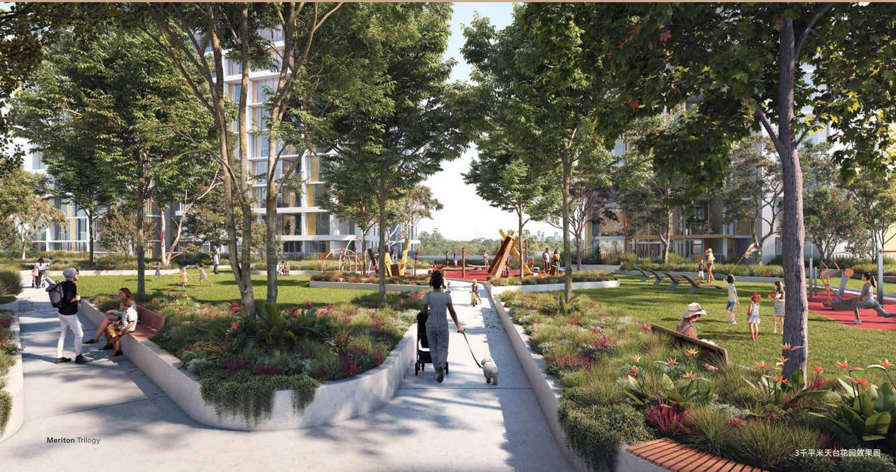
3千平米天台花园效果图

Trilogy将生活便利和社区氛围感作为项目的核心理念。这一活力生活社区的焦点将是一个拥有精美景观的3000平米中央空中花园。住户可尽享BBQ凉亭、儿童游乐区、社区花园和室外健身区等公用设施。