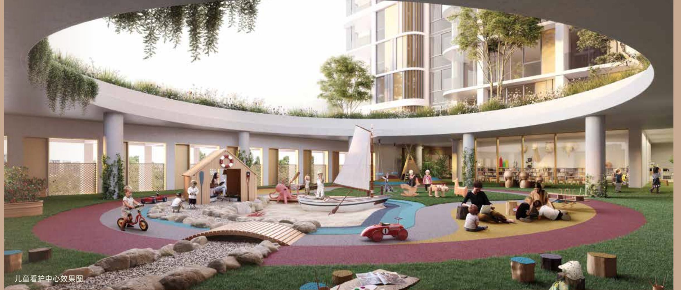
儿童看护中心效果图